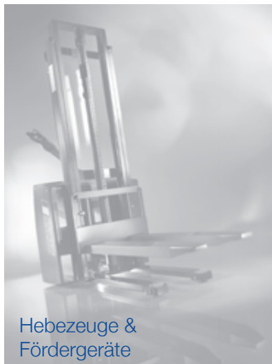
Hebezeuge & Fördergeräte