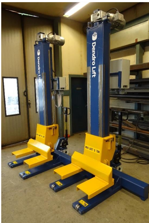
Svensktillverkad Dendro LB5T